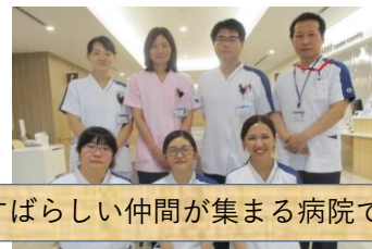
素晴らしい仲間が集まる病院です

※1週間前または2週間前を過ぎてからのご応募の際は、ご連絡ください。 ※上記以外はお相談ください。